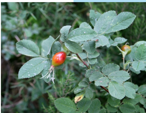
Roseira silvestre ( Rosa villosa )