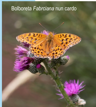
Bolboreta Fabrciana nun cardo