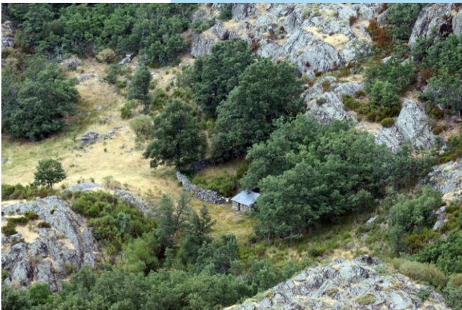
Refuxio de Pastores na subida a San Martín