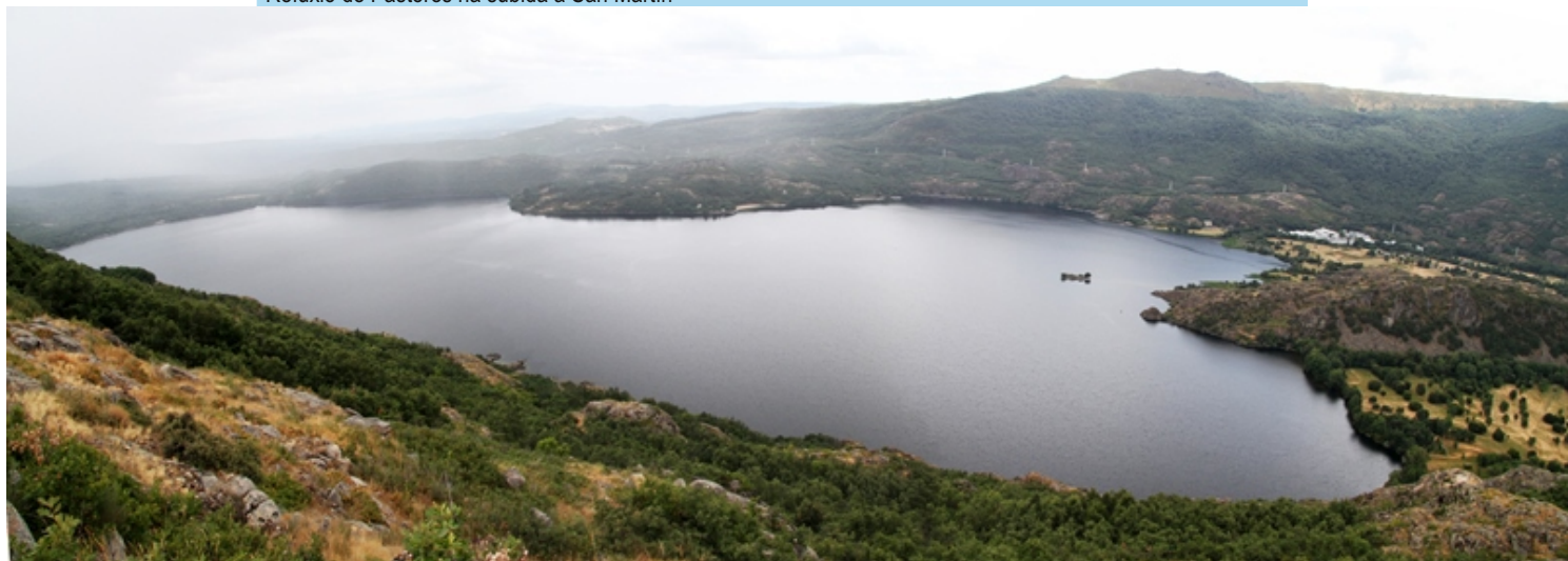
Vista do Lago de Sanabria desde o Sendeiro dos Monxes