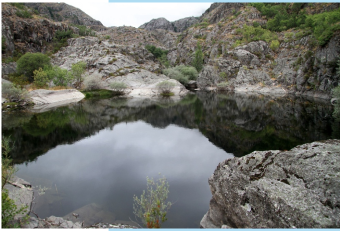
Pozo das Ninfas